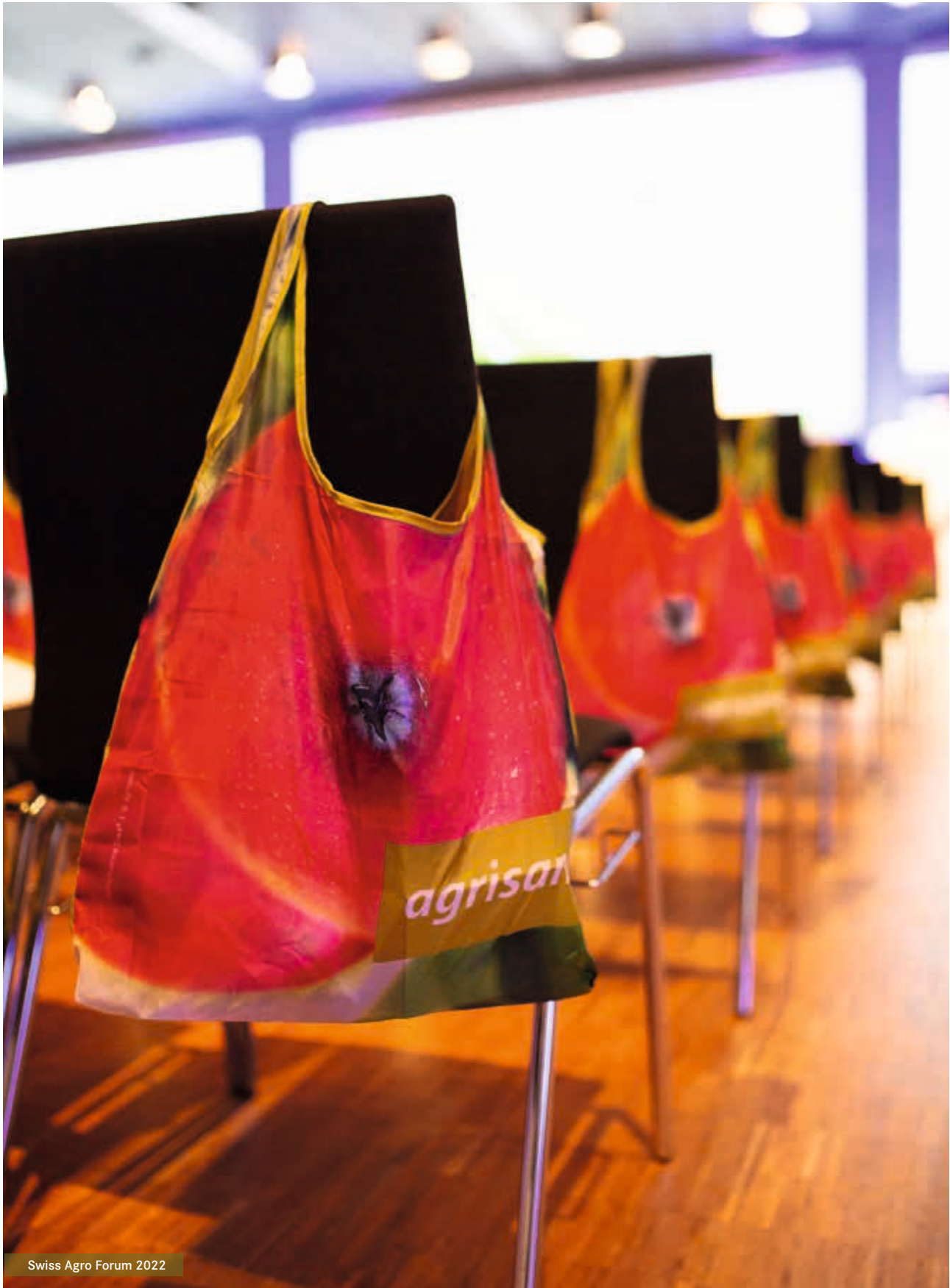
Swiss Agro Forum 2022