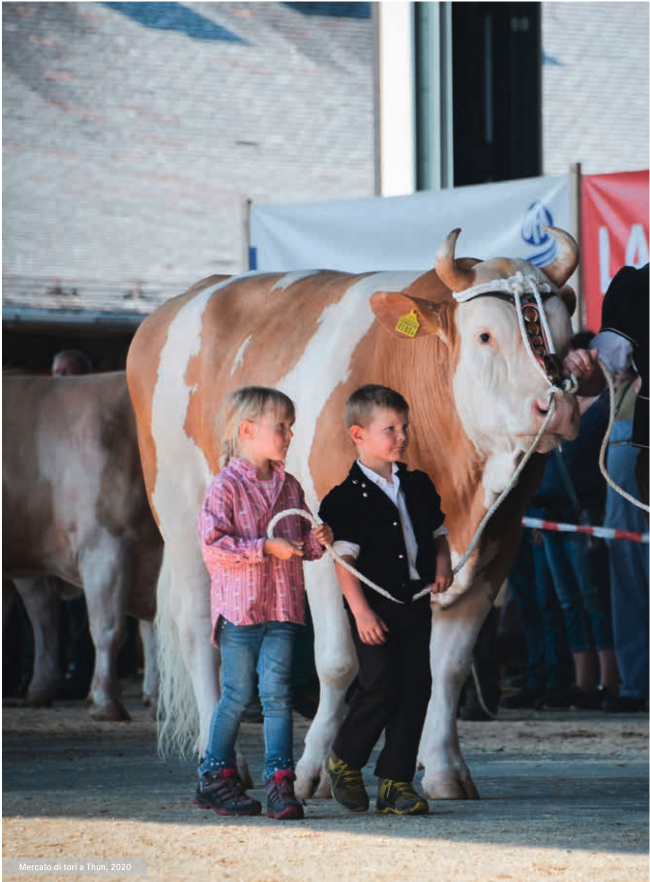
Mercato di tori a Thun, 2020